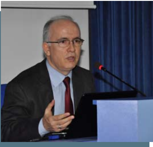
Prof. Dr. Cevdet Yılmaz

Samsun'da Büyükşehir Belediyesi kurulacak olan 'Kent Müzesi'ne üniversite olarak katkıda bulunmak amacıyla, Fen-Edebiyat Fakültesi Lacivert Salon'da toplantı düzenlendi.