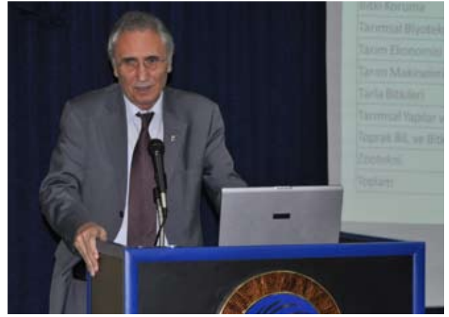
Vali Yardımcısı Mustafa Özer

Son konuşmacı Vali Yardımcısı Mustafa Özer ise, "Dünya üzerinde hayatın başlangıcı 900 milyon yıl önce olmuştur. İlk insanlar da tarım ve avcılık ile geçiniyorlardı. Zaman ilerledikçe insanlık ilkel toplumdan tarım toplumuna geçti. Bugün de tarım eğitiminin tam 166. yılı. Hocalarımı ve sevgili öğrencilerimi kutluyorum." dedi.