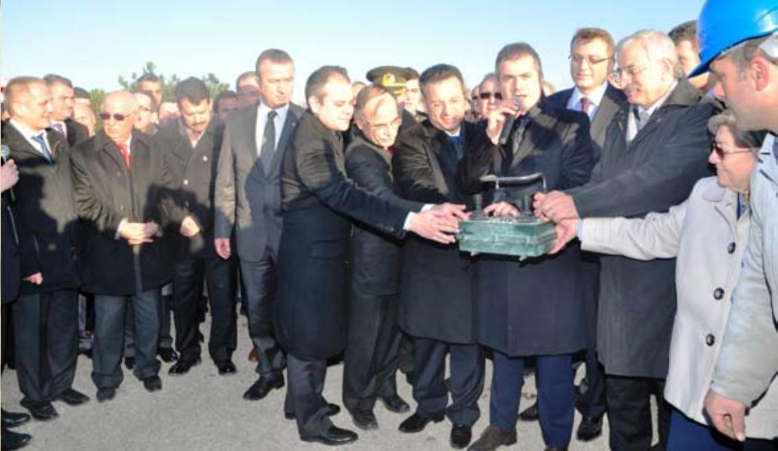
Konuşmaların ardından Bakan Suat Kılıç ve beraberindekiler, birlikte butona basarak fakültenin temelini attılar.