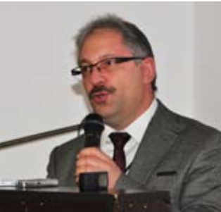
Prof. Dr. Ali Erbaş