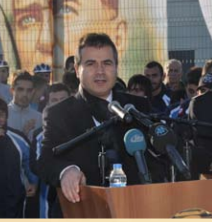
Bakan Suat Kılıç