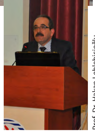
Prof. Dr. Hakan Leblebicioğlu

bizim kültürümüzü tanımalarını istiyoruz. Bu kapsamda değerlendirildiğinde Bologna Süreci'nin, bu öğrenci akışına olumlu katkı sağlayacağını düşünüyoruz. Gerçekten çok yetenekli ve sayısal olarak yeterli öğretim görevlisine ve 100'den fazla programa sahibiz. Bu süreç içinde verdiğimiz eğitimin kalitesini artırabilirsek hem Türk hem de Avrupa öğretim hayatına büyük katkı sağlayabileceğimize inanıyorum. Katılımınız için teşekkür ediyorum, başarılı bir toplantı olmasını diliyorum." şeklinde konuştu. "Bologna Sürecinin Tanıtımı" ve "Öğrenci Otomasyonu Bologna Süreci ile İlgili Menülerin Tanıtımı" ile devam eden toplantı, soru cevap bölümüyle sona erdi.