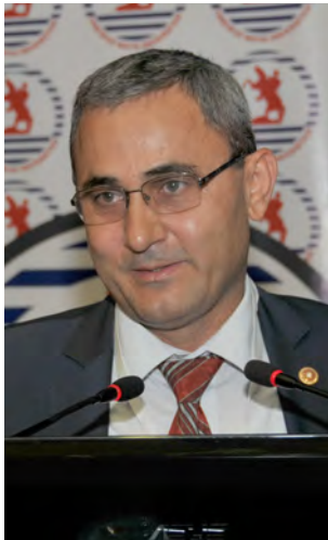
Kütahya Milletvekili Alim IŞIK

Ülkemiz coğrafi konumu itibarıyla çok değerli topraklara sahiptir. Topraklarımızı tarımsal alanda en iyi şekilde değerlendirmek için böyle toplantılar çok önemlidir diyen Kütahya Milletvekili Alim Işık'ın ardından son olarak konuşan Vali Hüseyin Aksoy ise, "Tarım sektörü en önemli sektörlerin başında gelmektedir. Samsun tarımsal alanda Türkiye'de önde gelen kentlerdendir. Bafra ve Çarşamba ovaları gibi önemli ekilebilir alanlara sahiptir. Kongrede emeği geçenlere ve destek veren kuruluşlara teşekkür ediyorum" diyerek, Samsun tarımı hakkında davetlilere bilgi verdi. Kongrenin açılış konuşmalarının ardından Samsun valisi Hüseyin Aksoy kongre sürecine verdiği desteklerden dolayı Büyükşehir Belediye Başkanı Yusuf Ziya Yılmaz'a plaket takdim etti.