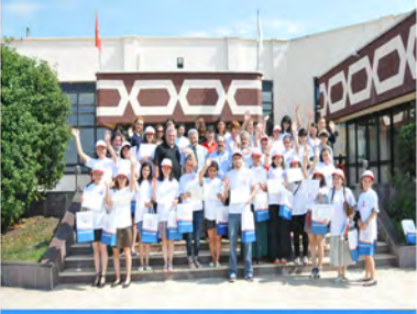
Gürcü Öğrenciler OMÜ'den Sertifikalarını Aldılar