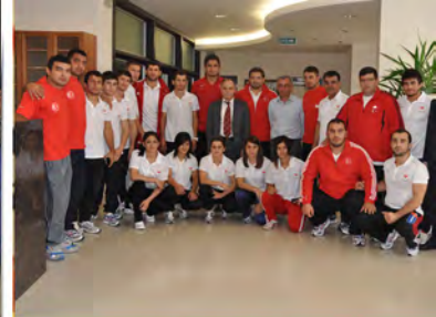
Milliler 17 Madalya Sözü Verdi