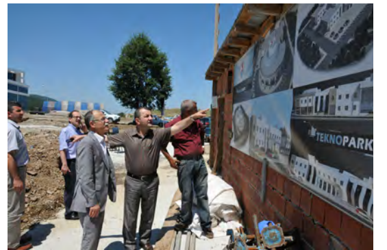
"Samsun Teknoparkın Açılışını 2013 Yılında Yapmak İstiyoruz"