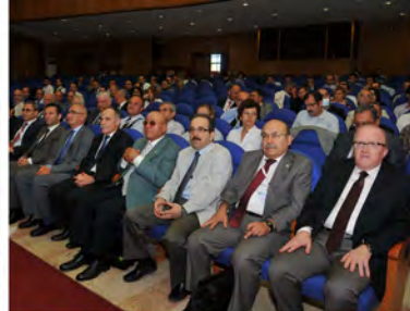
27. Tarımsal Mekanizasyon Ulusal Kongresi OMÜ'de Düzenlendi