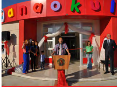
OMÜ Anaokulu Açıldı