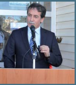
Dr. Mustafa Cora

rübeler yaşatma, bireylerin kendini tanımlarını sağlama, geliştirme ve gerçekleştirmesine katkıda bulunmaları açısından, olumlu bir etkiye sahiptir. Çeşitli etkinlik ve kurslar doğrudan doğruya üniversite öğretim elemanları tarafından ve üniversitenin mekânları içerisinde verilmektedir. Öğrencilerin ilgi duyduğu alanlarda bilimsel araştırma yapmalarına uygulamalı olarak fırsat verme, yüksek öğretime ve bilime ilgiyi artırma açısından Çocuk Üniversitesi önemli işlevlerde bulunmaktadır. Buna ek olarak OMU Çocuk Üniversitesinin uzun vadede; diğer kurum ve kuruluşlarla işbirliği yapmasını sağlama, kamu imkânlarının verimliliğini artırma ve çevremizdeki insan sermayesini etkili kullanma açısından etkili olacağı düşünülmektedir.