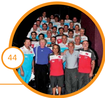
OMÜ'de Bir Tudor