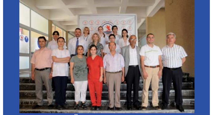
OMÜ Karaciğer Nakli Ekibi

OMÜ karaciğer nakli merkezi bu bölgedeki