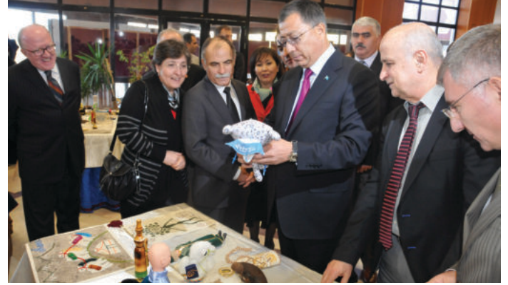
Panel öncesi "Kazakistan-Türkiye ile ilişkiler" başlıklı fotoğraf sergisi ile Kazakistan'a özgü el işi ve sanatları konuklarla buluştu.