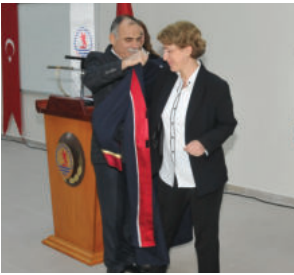
Konuşmaların ardından Rektör Akan ve protokol üye- leri İletişim Fakültesi öğretim üyelerine binişlerini giydirdi.

İnsanoğlunun var olduğu sürece haberleşme ve iletişim ihtiyacı içinde olduğunu belirten Akan, "Bugün dünyayı yöneten iletişimdir. İletişim çok büyük bir güç. Medya bence artık birinci kuvvet. Medya sayesinde kamuoyu oluşturulabiliyor. Ayrıca haberi sunuş şekli de çok önemli. İyi bir iletişimci kaynaklarını birkaç yerden teyit ederek doğrulamalıdır. Yapacağınız iş bu açıdan çok önemli. Gelecekte, 20-30 yıl sonrasında bu günü mutlaka heyecan ve sevgi ile anacaksınız. Buradan mezun olacak öğrencilerimiz gelecekte bugünlerini mutlaka gülümseyerek hatırlayacaklardır" şeklinde konuştu.