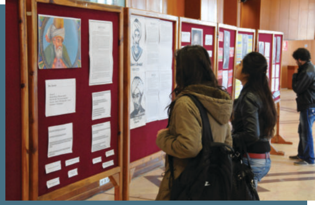
"Dünya Felsefe Günü" etkinliği kapsamında Atatürk Kongre ve Kültür Merkezi Fuaye Salonu'nda "Filozoflar Sergisi" açıldı. Sergi öğrencilerden büyük ilgi gördü.