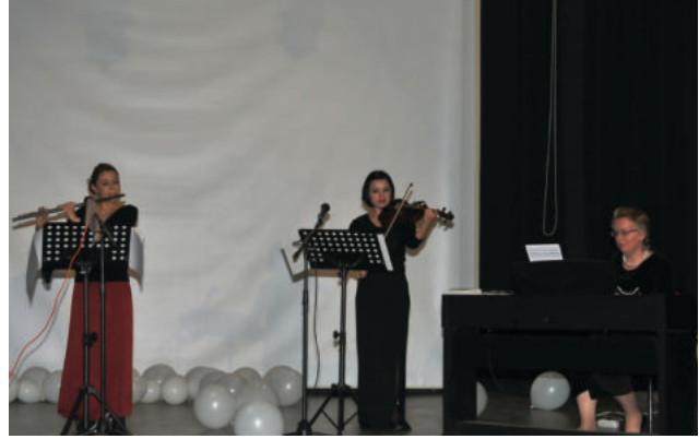
Plaketin töreninin ardından Motif Trio adlı grup katılanlara müzik dinletisi sundu.