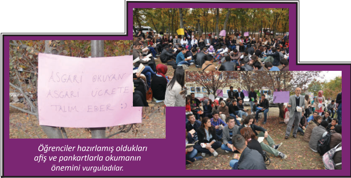
Öğrenciler hazırlamış oldukları afiş ve pankartlarla okumanın önemini vurguladılar.