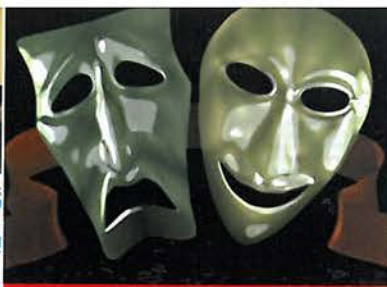
27 Mart Dünya Tiyatrolar Günü