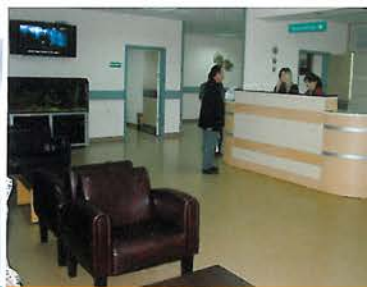
"Yüzü Gülen, Yüz Güldüren Hastane" Yenilendi