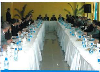
Samsun Teknopark A.Ş. Ana Sözleşmesi İmzalandı