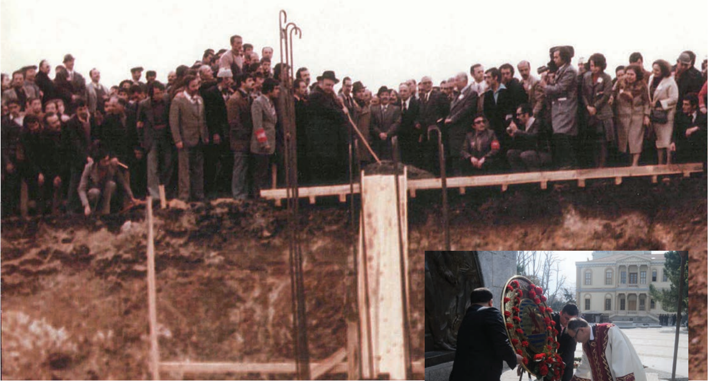
27 Mart 1976 Başbakan Demirel temele ilk harcı koyuyor.