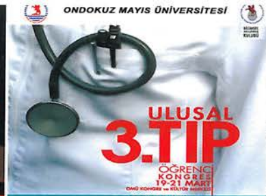
Ulusal 3. Tıp Öğrenci Kongresi