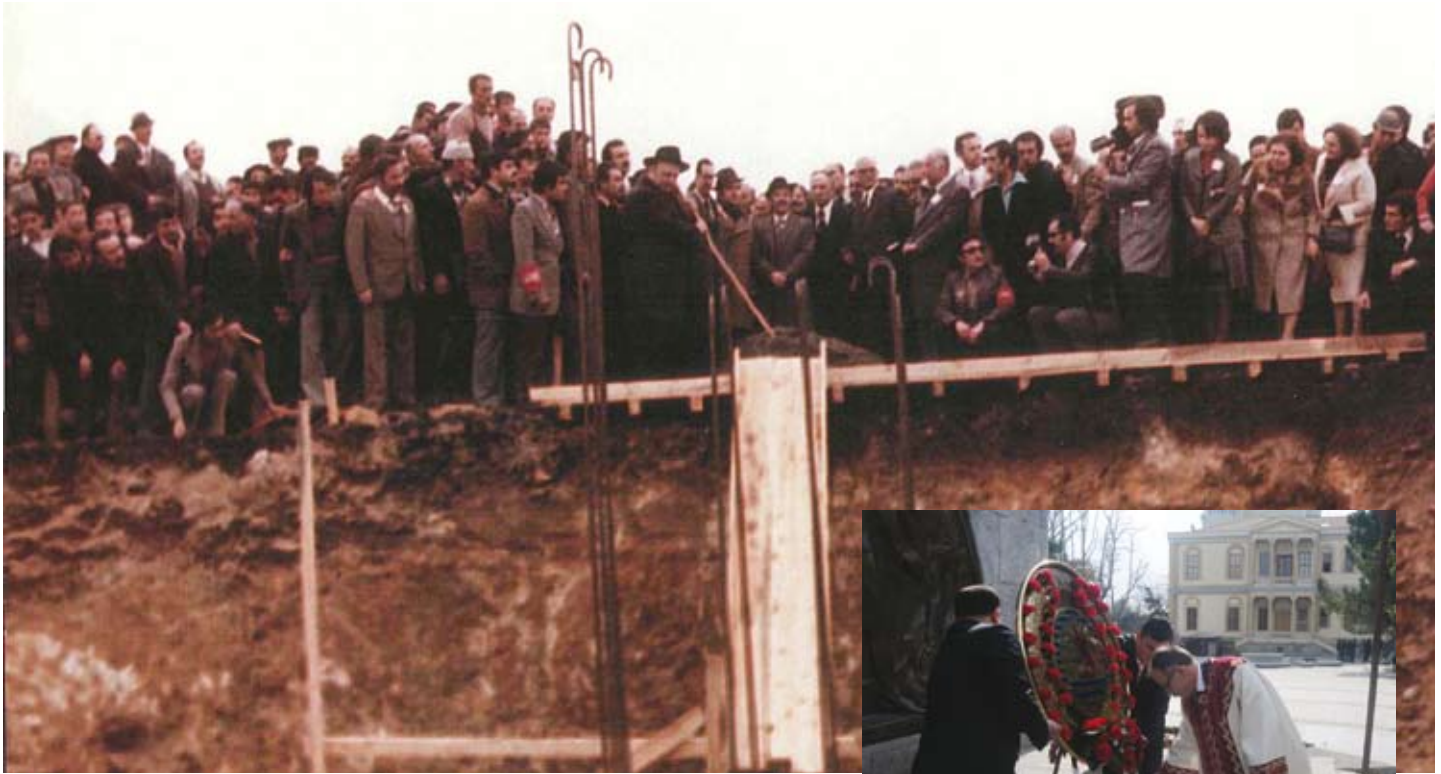
27 Mart 1976 Dönemin Başbakanı Demirel temele ilk harcı koyuyor.