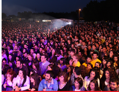
9. Bahar Şenliği