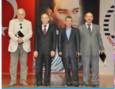
Türk Şiirinin Son 35 Yılı