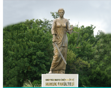
VII. Türk - Alman Tıp Hukuku Sempozyumu